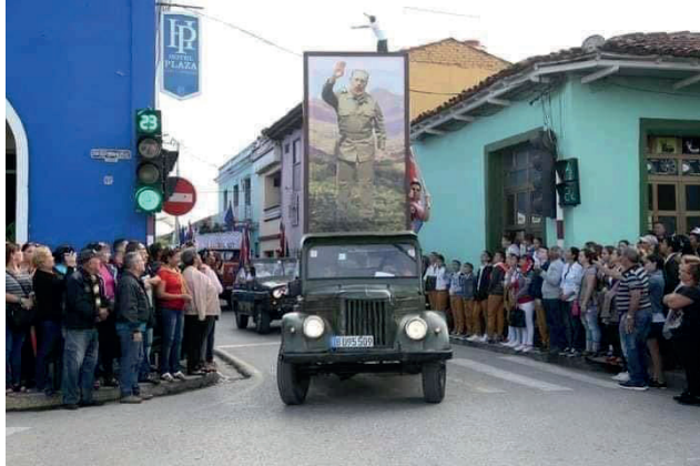
Imágenes de la propaganda castrista: el “desfile” de un cuadro de Fidel.