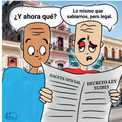
Caricatura Decreto Ley 35 en Cubanamente.

El pastor atesora pasajes bíblicos donde hay oposición al poder gubernamental por sus intentos por controlar la libertad de conciencia, como en el que Nabucodonosor decretó muerte a quien no se postrara delante de la estatua en su honor. Tres jóvenes fueron fieles a Dios, y Dios les fue fiel.