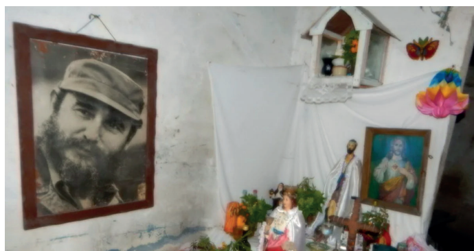
Imágenes de la propaganda castrista: Fidel en un altar de la religión yoruba.