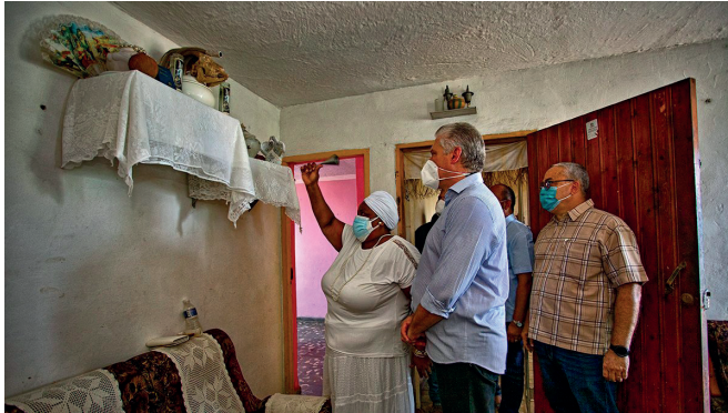
Miguel Díaz-Canel en La Güinera, el 20 de agosto de 2021, visita la casa de la santera Iliana María Macías.

porque mucho halago y todo muy bonito, pero no es de la boca para afuera, es en el corazón” 318 .