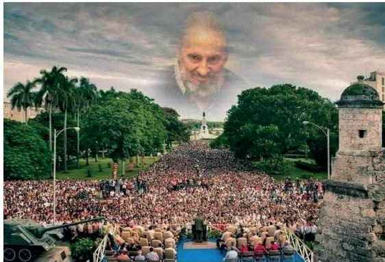
Imágenes de la propaganda castrista: “aparición” de Fidel entre las nubes (redes sociales).

#FidelPorSiempre #CubaViveEnSuHistoria #ComercioCuba