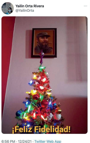
Imágenes de la propaganda castrista: el Fidel de las Navidades comunistas (redes sociales).

En una visita de Miguel Díaz-Canel al municipio Río Cauto, varias mujeres entrevistadas por la televisión estatal expresaban en clave religiosa su admiración por el dictador. Una dijo que verlo le había recordado “al dios Fidel”, otra que su visita había sido “un regalo de Dios” y que poniendo “sus pies benditos” en aquel paupérrimo poblado se resolverían los problemas locales 306 .