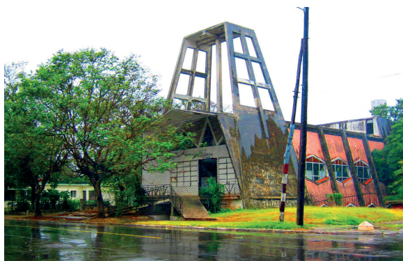
Imagen reciente de la Iglesia Luterana de 7ma Avenida, en La Habana.