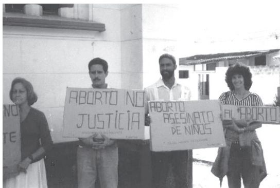
Manifestación provida.