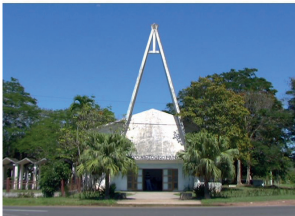
Imagen reciente de la Iglesia Luterana de Nueva Gerona.

caladas en losas triangulares a la entrada 76 . Usurpada por la Revolución en 1963, y reabierta en los años 1970 como Academia de Ciencias local, hoy es un semiderruido archivo estatal. La segunda iglesia luterana, en la capital, vivió similar suerte. La torre-campanario estaba sostenida por tres cruces. Los revolucionarios cortaron los brazos de la central, hasta dejar una simple columna, y a las laterales se les añadió un segundo eje horizontal de cemento. En ambos casos, hubo una intención de desproveer a los edificios de su profundo significado espiritual y cultural. El castrismo deconstruyó la imagen de los templos para, así, vaciarlos de sentido y ponerlos en servicio del Estado.