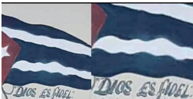
Imágenes de la propaganda castrista: “Dios es Fidel”.

El culto a la personalidad, una vez fallecido Castro, alcanzó matices de devoción. El diputado a la ANPP, Yusuam Palacios llegó a decir que el dictador “alimenta cada día la virtud de millones de seres humanos” y “ha de vivir eternamente en la religiosidad popular” 305 .